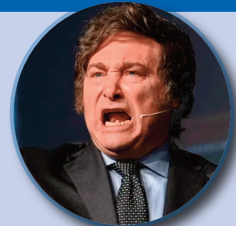
Javier Milei, presidente

“ Fue un error hablar con los gobernadores de manera transparente y honesta ”