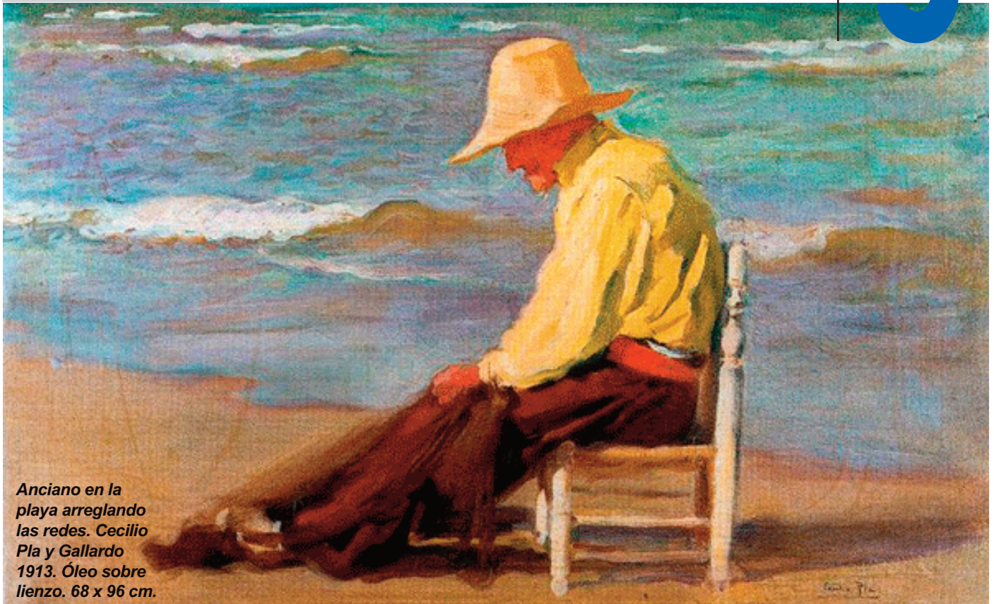
Anciano en la playa arreglando las redes. Cecilio Pla y Gallardo 1913. Óleo sobre lienzo. 68 x 96 cm.