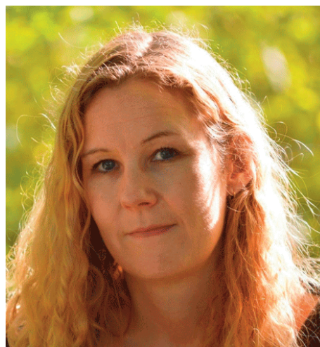
La arqueóloga británica y experta en el antiguo Egipto Charlotte Booth

Un artículo de la BBC de Londres explica que “ en algunos sentidos fueron más “modernos” que nosotros ”. Eso es lo que puede concluirse al analizar las costumbres sexuales y de pareja de esta civilización que nació más de 3.000 años antes de Cristo.