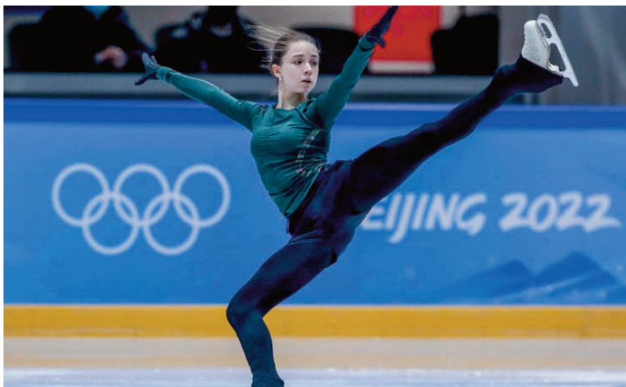
Kamila Valieva, patinadora rusa que hizo historia con su salto cuádruple, dio positivo en una prueba de dopaje

En 2014 Sun Yang campeón chino de natación que participó en tres Juegos Olímpicos (2 medallas doradas en