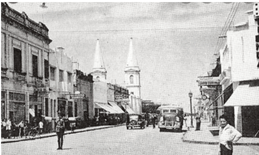
Calle Olavarría en 1950

Italia ya se expandía en África y muchos se entusiasmaron con una colonización de Argentina. Había políticos que afirmaban que Italia tenía “colonias espontáneas” en el país y en Uruguay. A partir de 1870 en Europa surgieron ideales que sostenían la autodeterminación de los pueblos, que hizo crecer el sentimiento de nacionalidad. Se sostenía que el derecho del más fuerte otorgaba el poder de la legitimidad.