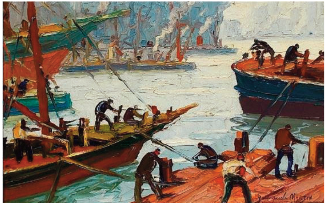
Obra de Quinquela Martín

Se inició un proceso donde se invitó a los extranjeros a nacionalizarse, a participar de la vida política y en las escuelas se instruyó a los maestros a inculcar sentimientos patrióticos. Hasta 1884 no se cantaba el Himno,