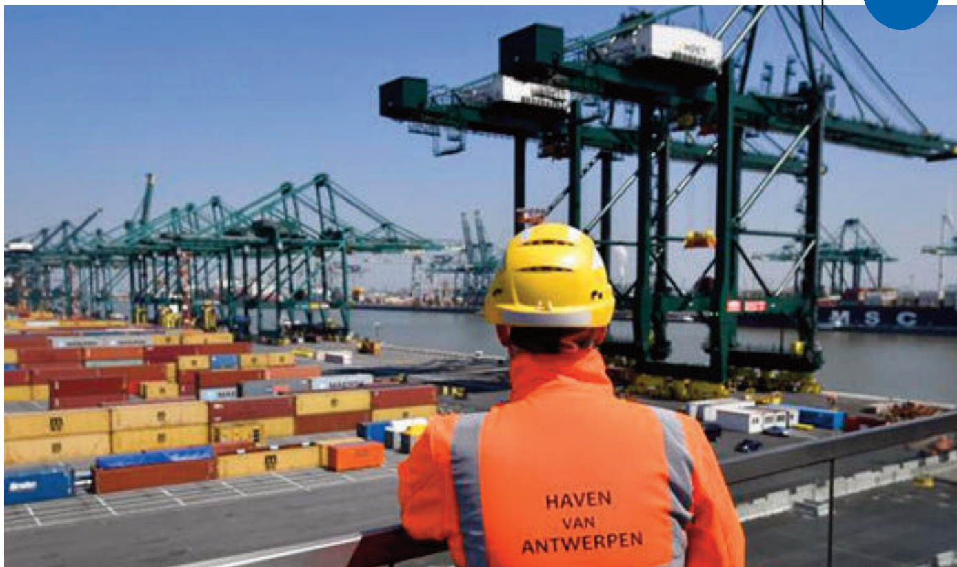
El monumental Puerto de Amberes no sólo es la principal puerta de entrada de la cocaína a Europa. La opacidad en el mercado de venta de diamantes también lo ha convertido en un centro de lavado de dinero ilegal.