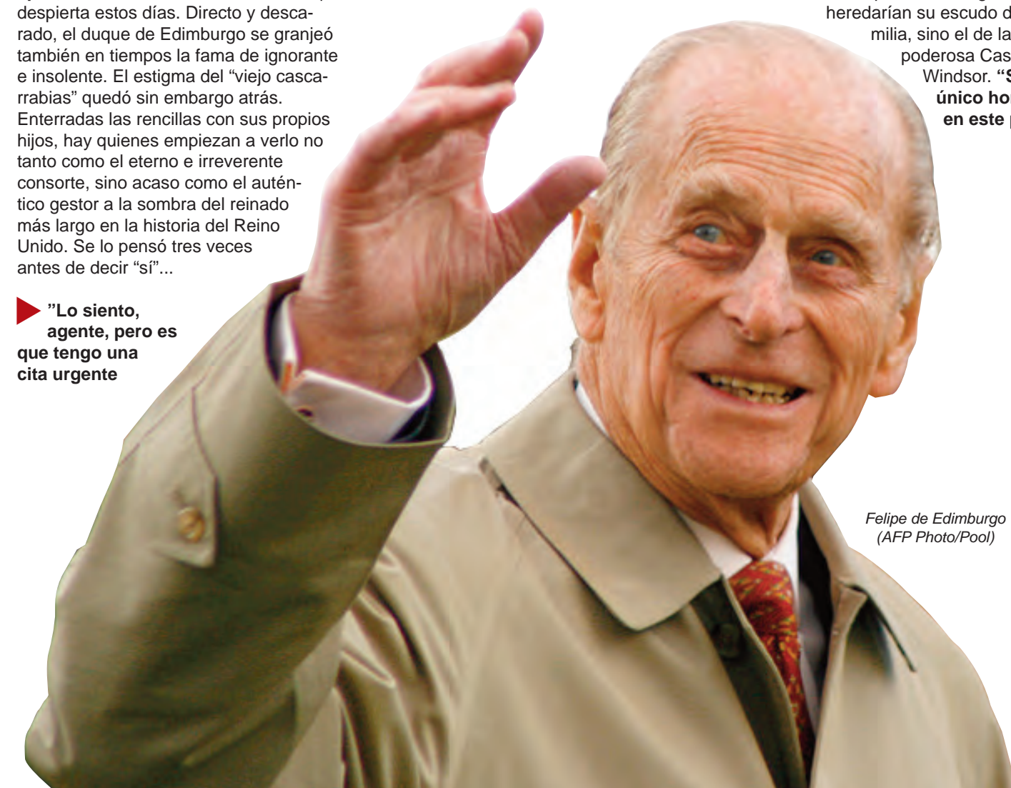
Felipe de Edimburgo