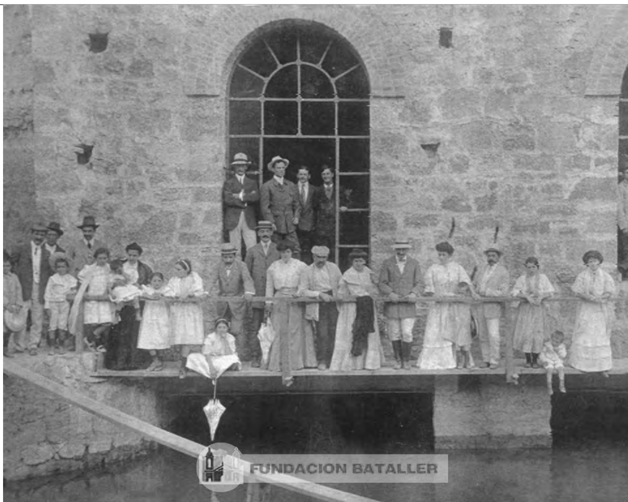
El edificio de la Usina de Zonda, construido en piedra. La usina aprovechaba un salto de 7,50 metros, sobre el estero. Daba 1.000 caballos de potencia.

Todas las fotos con historias se reproducen en el portal www.fundacionbataler.org y en www.sanjuanalmundo.com