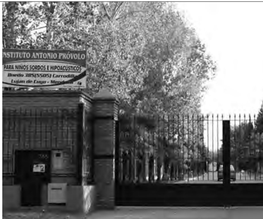
Entrada al Instituto Próvolo, de Mendoza