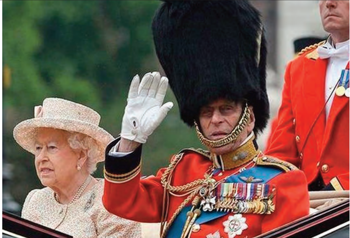
Isabel y Felipe de Edimburgo llegan a los festejos por el cumpleaños de la Reina

El incidente provocó una de las clásicas reacciones coléricas del príncipe,