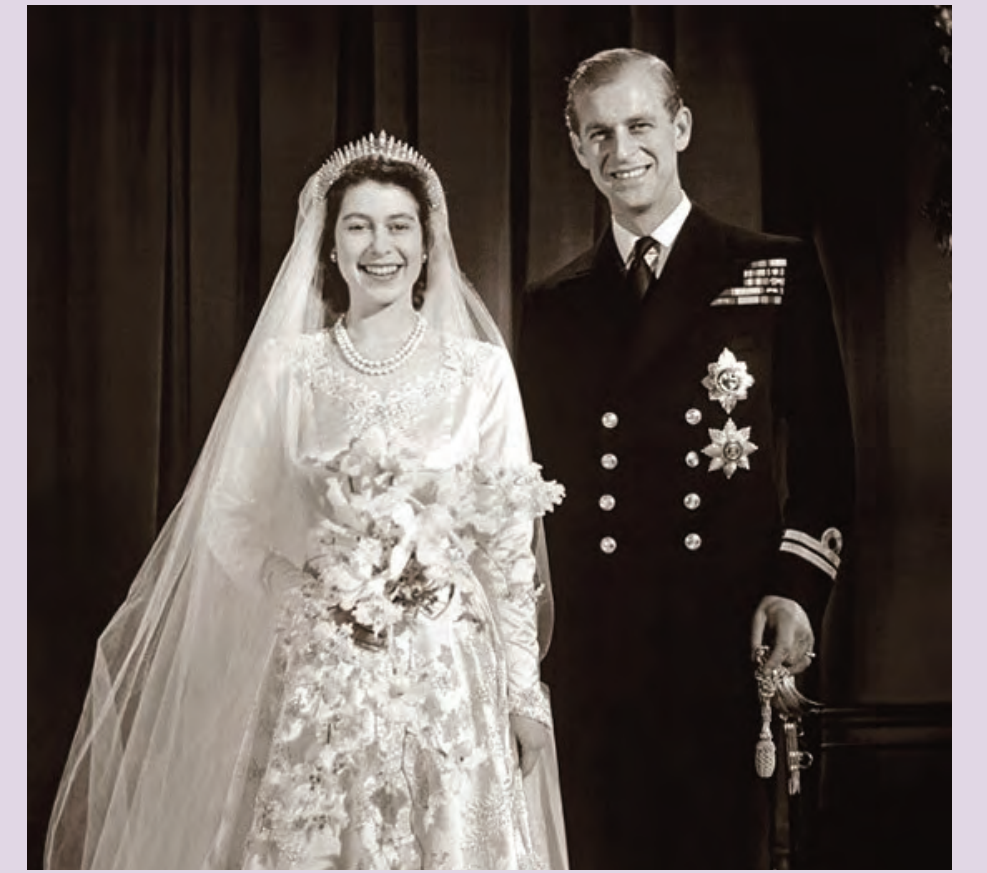
20 de noviembre de 1947, día del casamiento de la princesa Isabel y el príncipe Felipe