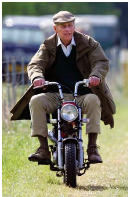
Felipe de Edimburgo montado en una mini moto, durante el show ecuestre real de 2005, en Home Park.