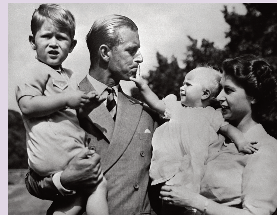
1951. La pareja real junto a los príncipes Carlos y Ana, en Balmoral

Enamorado o no, Felipe mantuvo correspondencia con Isabel durante toda la II Guerra Mundial, mientras servía en la Marina británica y sin hacer demasiado caso de otros pretendientes, ella le esperó hasta su regreso de Asia en 1946, cuando floreció un idilio que la corte de Londres observó con escepticismo. Aunque había transcurrido ya una década, la monarquía no se había repuesto aún del todo de la abdicación de Eduardo VIII por el amor de Wallis Simpson, y no podía permitirse un nuevo paso en falso. Se desconfiaba del casamentero Lord Mountbatten y de su protegido, un joven que pertenecía a una rama marginal y empobrecida de la realeza europea, estrechamente vinculada a Alemania en una época en que la germanofobia