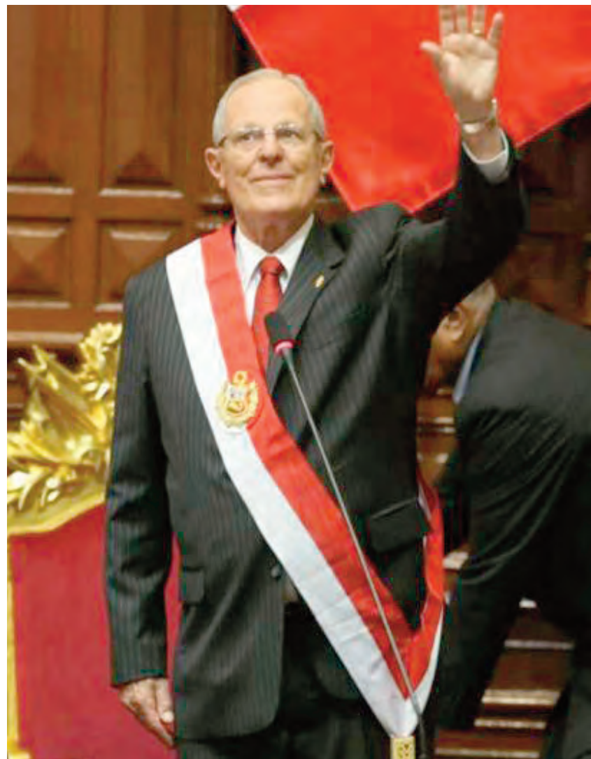
El presidente peruano, Pedro Pablo Kuczynski, dispuso de medidas muy duras contra actos de corrupción en su país

▶ Según el periodista de diario La Nación Hugo Alconada Mon -quizás hoy el que mejor investiga en Argentina- "el jueves comenzará un proceso que dependerá de la letra chica cuánto puede llevar. Brasil dijo que al enviar la información, se debe