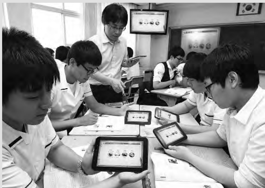
Corea del Sur

Los alumnos tienen la posibilidad de que sus clases se dicten en francés o en inglés, gracias a que Canadá es considerado uno de los países líderes en educación bilingüe. Los chicos estudian de manera obligatoria desde los 5 o 6 años y hasta los 18. Se da atención personalizada al alumnado inmigrante y se focaliza en la aceptación de la diversidad en el aula. La educación social y emocional tiene como horizonte prevenir las situaciones de agresión y acoso escolar. Canadá tiene uno de los índices de graduados de universidades más altos del mundo.